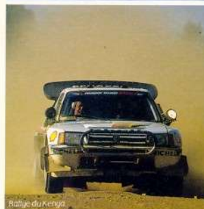
Rallye du Kenya