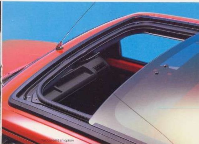
toit ouvrant en option