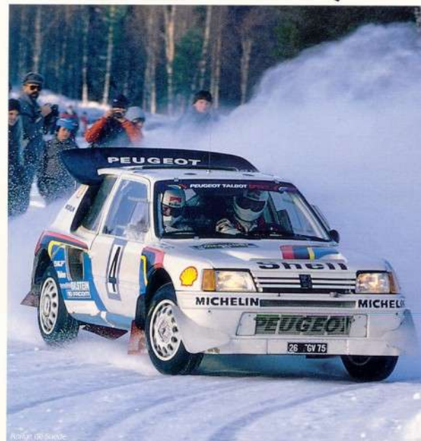
Rallye de Suède